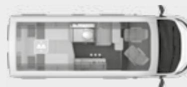
BOXLIFE 600 ME