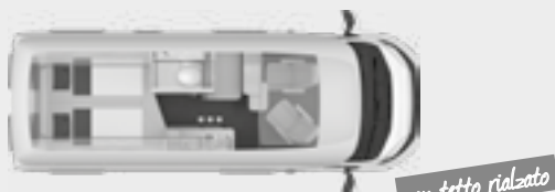
BOXSTAR 600 LIFETIME XL