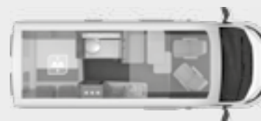
BOXLIFE 600 DQ