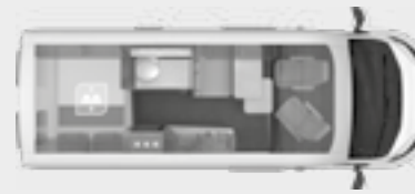
BOXLIFE 600 MQ