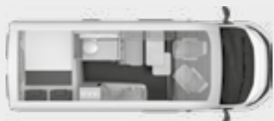
BOXSTAR 600 FAMILY