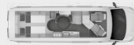
BOXDRIVE 680 ME