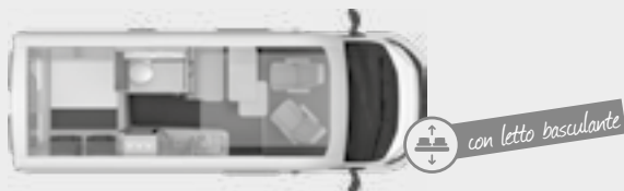
BOXSTAR 600 SOLUTION