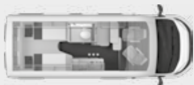
BOXSTAR 600 LIFETIME