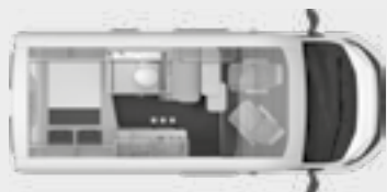
BOXSTAR 540 ROAD