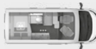
BOXLIFE 540 MQ