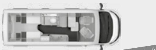
BOXSTAR 630 FREEWAY